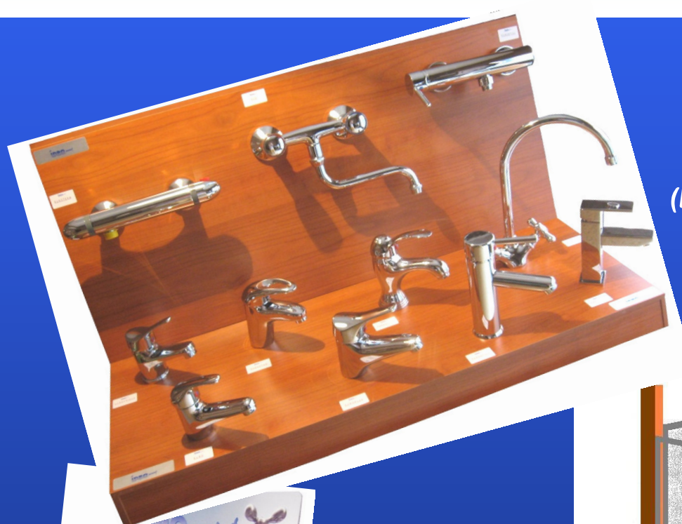
Art. 990070 espositore in legno per rubinetteria (L cm. 100 x P cm. 40 x H cm. 60)